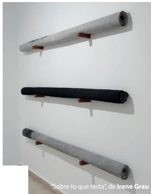
"Sobre lo que resta", de Irene Grau