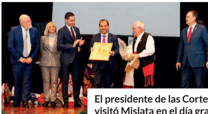
El presidente de las Cortes de Castilla-La Mancha visitó Mislata en el día grande del pueblo manchego

Los Premios Literatura Breve Vila de Mislata buscan fomentar los valores literarios entre la población adulta, así como también abrir una vía para descubrir talentos literarios que hasta el momento permanecían ocultos.