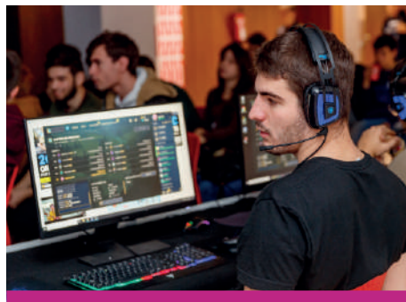
La Gaming Experience llena el centro La Fábrica de jóvenes