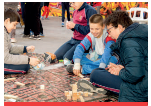
Mislata juega en el Día de la Infancia tras lograr un premio internacional de UNICEF