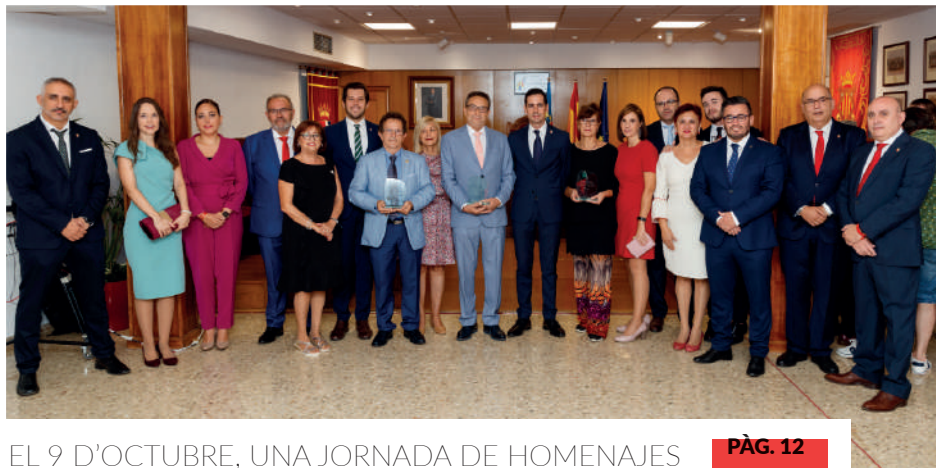
EL 9 D'OCTUBRE, UNA JORNADA DE HOMENAJES PÀG. 12