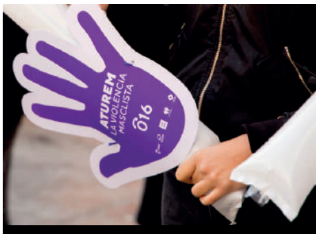
El mes contra la violencia machista involucra al tejido social