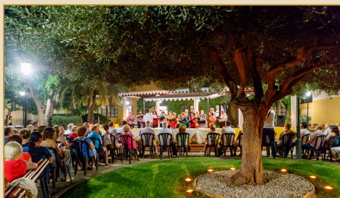
LA RAMÓN IBARS VA FINALITZAR EL CURS AMB UN CONCERT MOLT ESPECIAL.