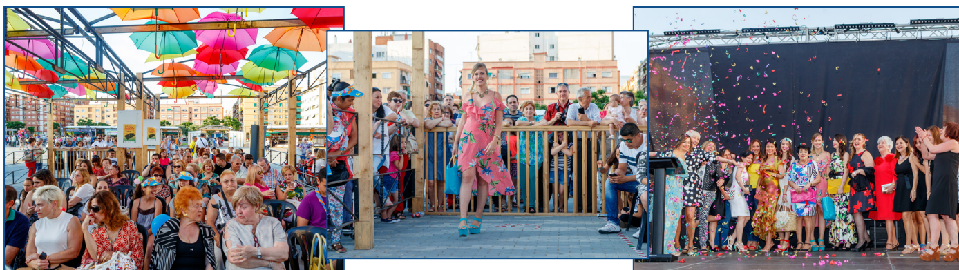
POR LA PASARELA DESFILARON LAS ÚLTIMAS CREACIONES DE MODA INFANTIL Y PARA ADULTOS, ROPA DEPORTIVA Y HASTA MODELOS DE PELUQUERÍA Y DE ESTÉTICA.

organización y de los establecimientos participantes, que han hecho un balance muy positivo de la feria. Especialmente animadas fueron las noches, con lleno en las terrazas de los bares de la feria y con mucho público recorriendo el recinto. Y la pasarela de moda, que sin duda la actividad más exitosa del fin de semana.