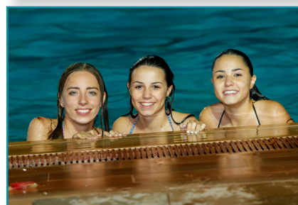
ATRACCIONS AQUÀTIQUES DEL PROGRAMA D'OCI NOCTURN.

de Joventut i la Unitat de Prevenció Comunitària de les Conductes Addictives (UPCA) i compta amb la participació de 10 joves seleccionats en una convocatòria de voluntariat i onze associacions locals.