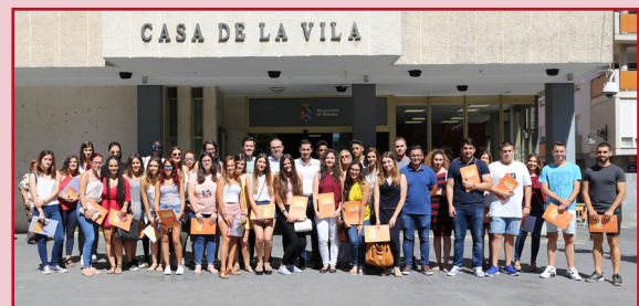
RECEPCIÓN DE LOS 33 JÓVENES BECADOS ESTE VERANO.