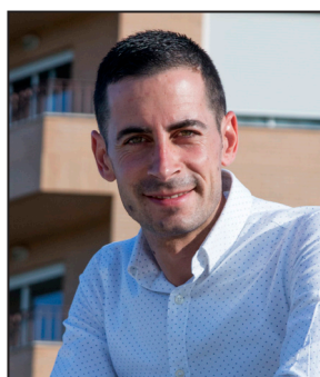
Carlos Fernández Bielsa Alcalde de Mislata