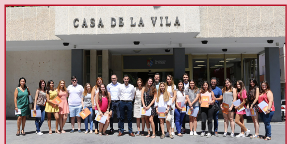
OTROS 18 JÓVENES RECIBEN BECA DE LA CONVOCATORIA MUNICIPAL.