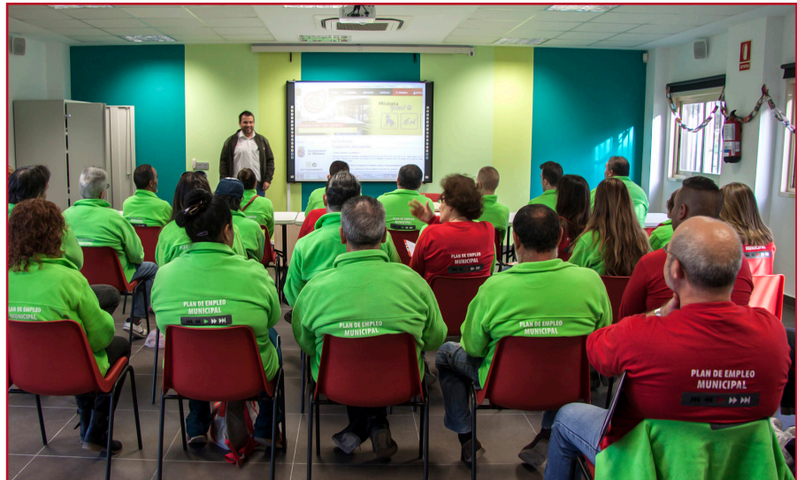
TRABAJADORES DEL ANTERIOR PLAN SOCIAL DE EMPLEO, EN UNA CLASE FORMATIVA.

El gobierno de Mislata recupera así uno de sus proyectos más importantes en materia de empleo y formación, un Plan que permitirá acceder a un puesto de trabajo a muchas personas en riesgo de exclusión social, que están atravesando graves problemas económicos o tienen situaciones sociales delicadas en su unidad familiar.