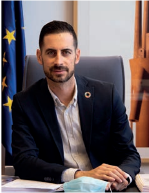
Carlos Fernández Bielsa Alcalde de Mislata