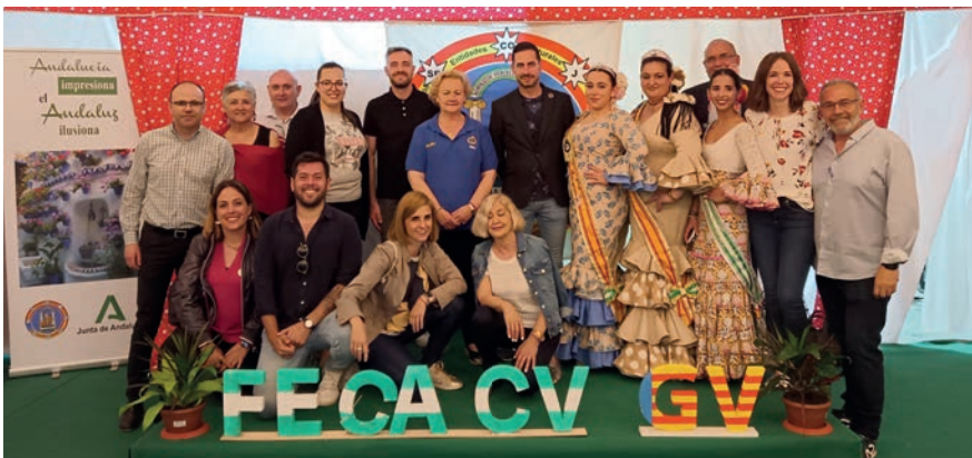
A la celebración de la caseta de la Asociación Cultural Andaluza de Mislata en la Feria de Andalucía en València, ubicada este año en La Marina, asistió representación del gobierno municipal.

ciudadanas con arraigo andaluz, y que diariamente trabajan desde la asociación en el cuidado y la divulgación del arte, el patrimonio y la cultura de esta tierra con la que Mislata está muy vinculada. Un fin de semana lleno de tradiciones como colofón a la feria de abril.