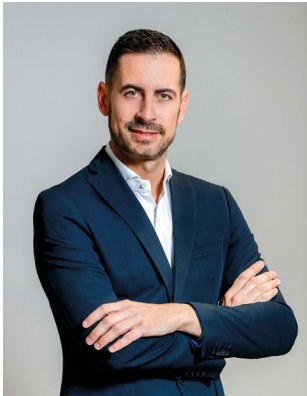
Carlos Fernández Bielsa Alcalde de Mislata